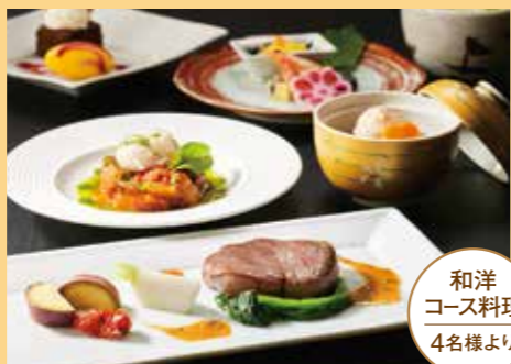
和洋コース料理 4名様より