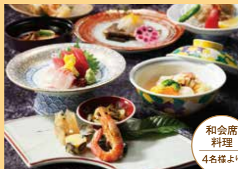
和会席料理 4名様より