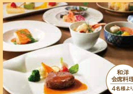
和洋会席料理 4名様より